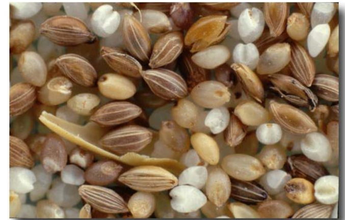
Grains de fonio